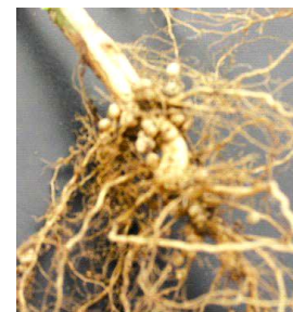
Racines soja inoc

Défricher la parcelle et procéder au labour (manuel ou mécanisé) à plat ou en billon avant la préparation des semences