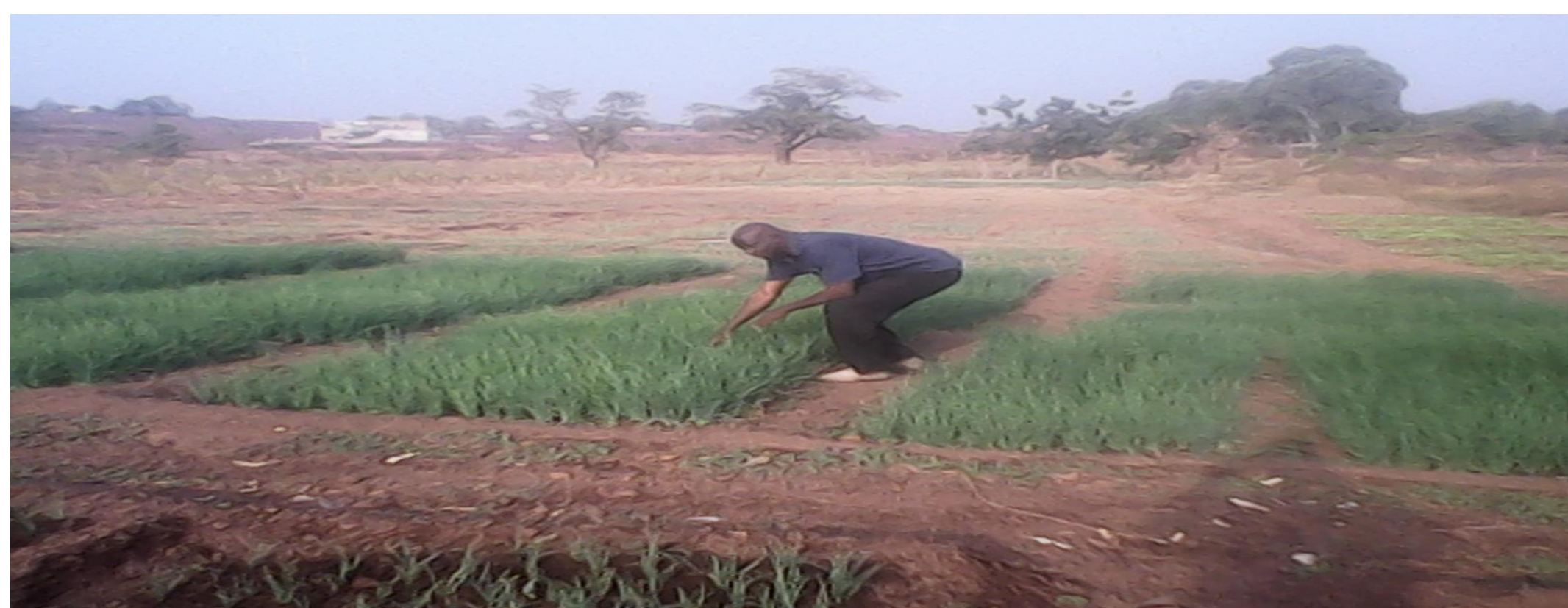
Sol dégradé restauré pour le maraichage