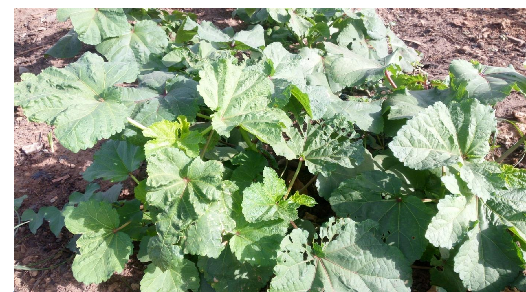
Un pied de gombo dans un trou fertilisé