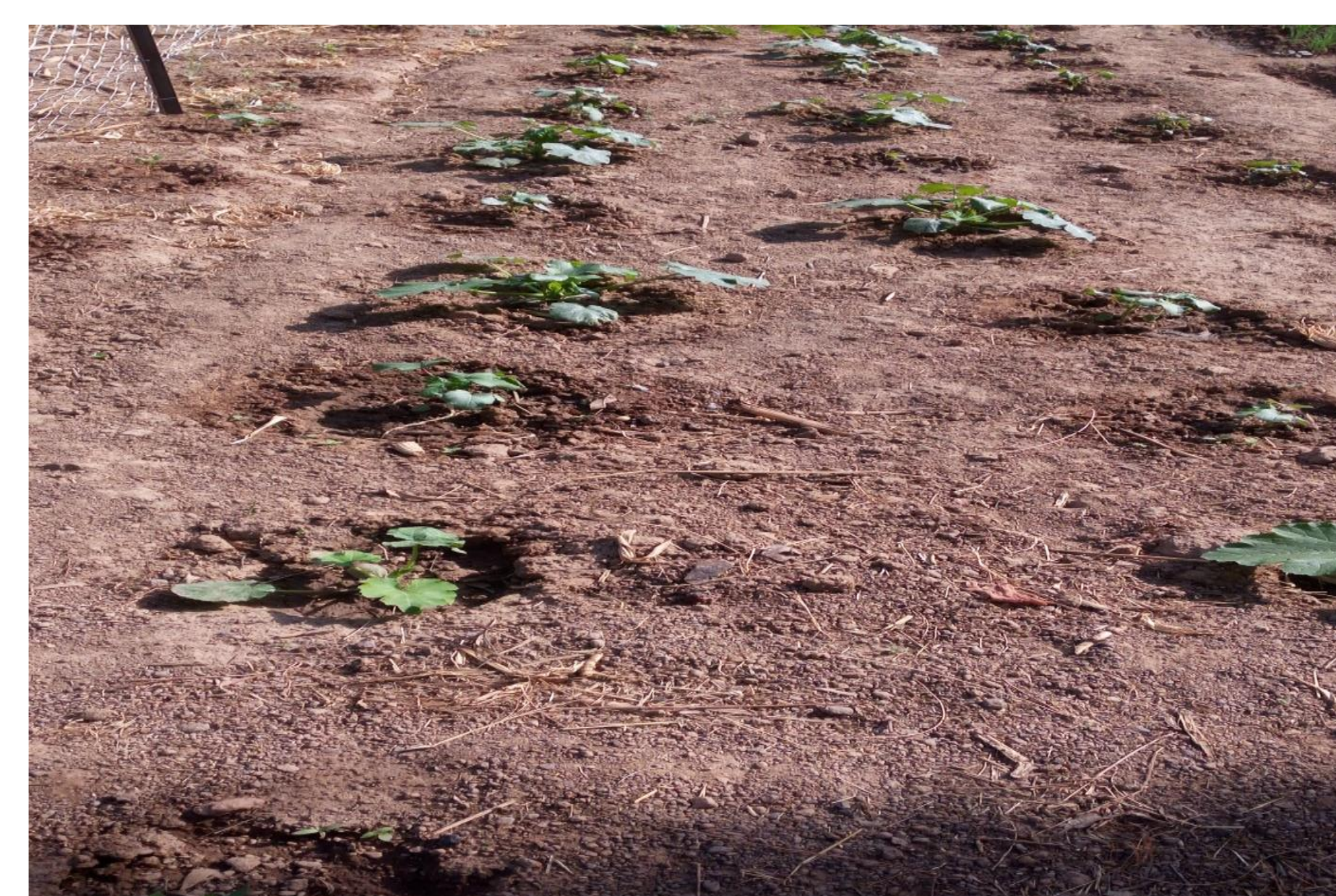
L'application du Zaï