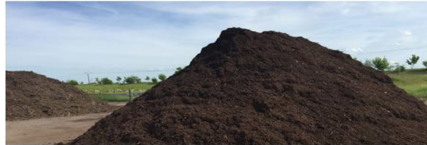
COMPOSTE PRET A EMPLOIER