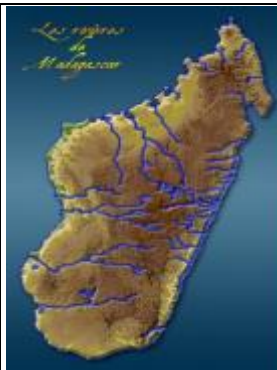
CETTE CARTE REPRESENTE DES SOURCES DES FLEUVES DANS TOUTES REGIONS DE MADAGASCAR