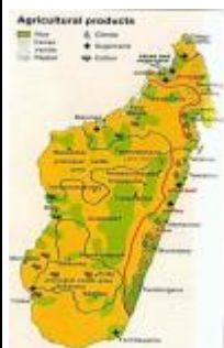
CETTE CARTE REPRESENTE DES TERRAINS AGRICOLES ET DES PRODUITS DANS TOUTES REGIONS DE MADAGASCAR