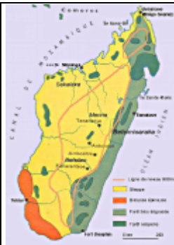
CETTE CARTE REPRESENTE DES RESERVE FORESTIERS DANS TOUTES REGIONS DE MADAGASCAR